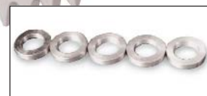
Afstandsringen Aluminium 5 stuks, 2,7 mm Ø16 mm Artnr. 590902